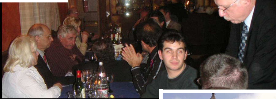
Le lieu, l'ambiance et le dessert - une triple omelette norvégienne.